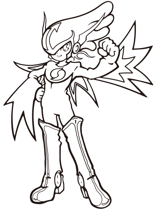
強小戦士 ガイナマン